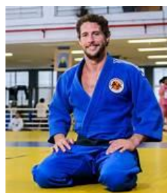
Flávio Canto 2023