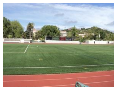
Pista de Atletismo e Campo Futebol